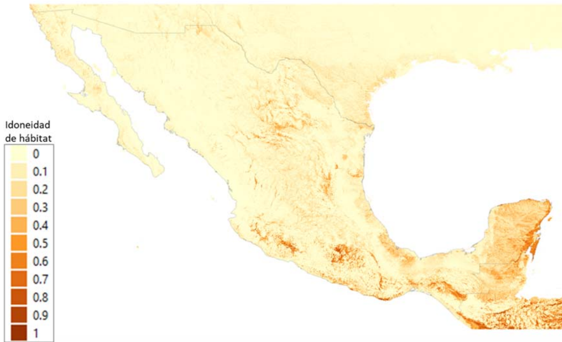
Figura 1. Distribución potencial de Amatitlania nigrofasciata en condiciones climáticas presentes en México de acuerdo al modelo de nicho generado por Maxent. Valores cercanos a 1 indican mayor idoneidad de hábitat.

5- ¿Cuál es la calidad de la información para determinar la coincidencia climática?